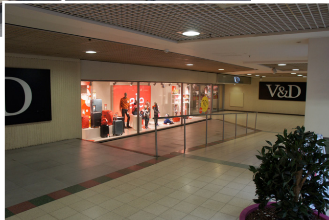
de 'verstopte' entree van de V&D op het maaiveld niveau